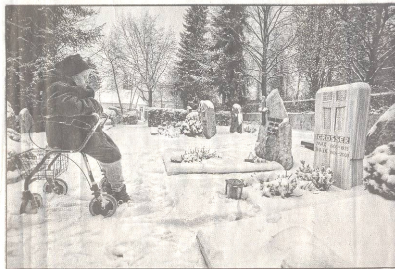
Aussprache auf dem Friedhof: die 67-Jährige erzählt ihrer toten Mutter, was sie beschäftigt.